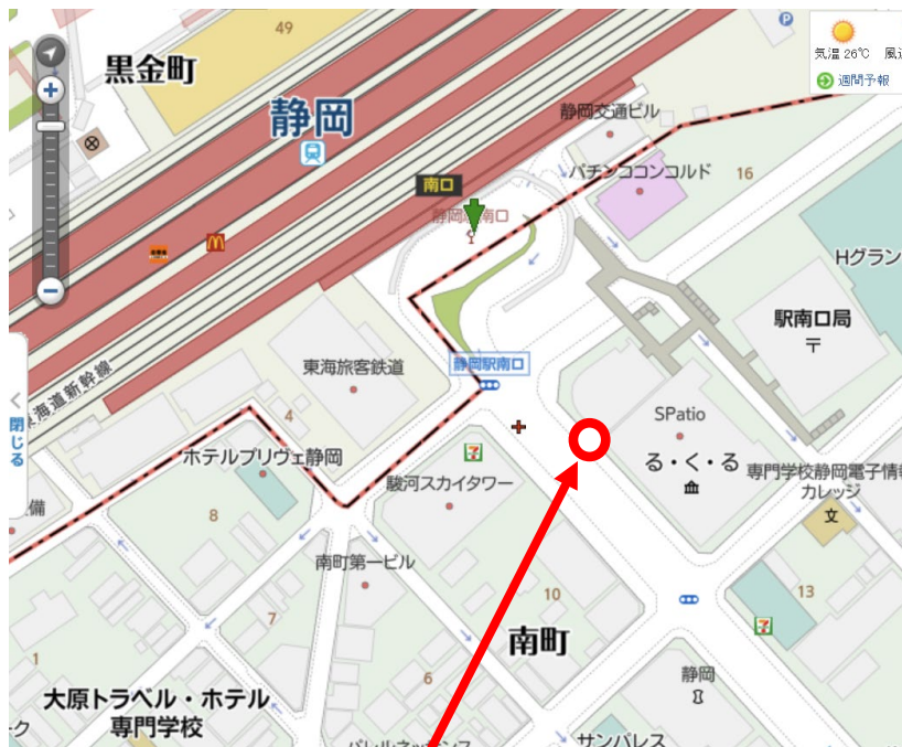
集合場所：静岡駅南口（スルガ銀行静岡南支店前）